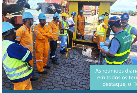
As reuniões diárias de segurança (RDS) foram realizadas em todos os terminais com escalação do OGMO-ES. No destaque, o Terminal de Produtos Siderúrgicos (TPS)

Pelo quarto ano, a programação ocorreu de forma integrada à Semana